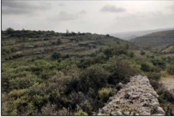
Αρ. Τεμαχίου: 1917, Αρ. Εγγραφής: 0/13016