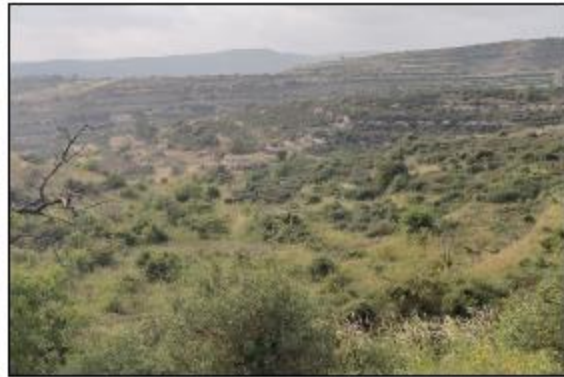
Αρ. Τεμαχίου: 1803, Αρ. Εγγραφής: 0/11863 & Αρ. Τεμαχίου: 1804, Αρ. Εγγραφής: 0/11891